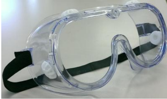
Hình 2: Kính bảo hộ